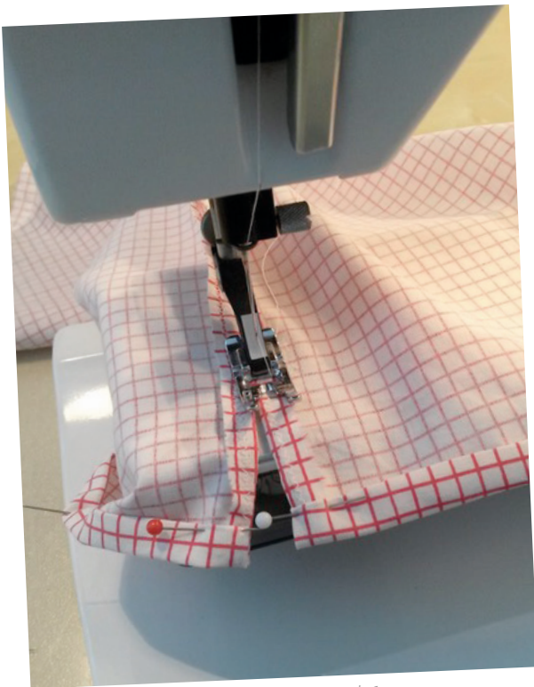
Abbildung zeigt Arbeitsschritt 5 und 6